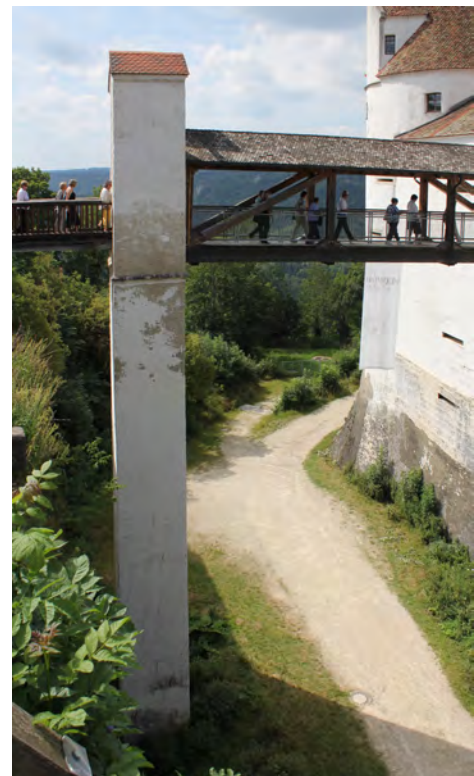
Burggraben und Zugang von Burg Wildenstein