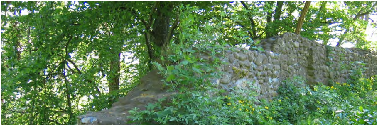
Nellenburg bei Stockach – geringe Mauerreste von der Stammburg des einst mächtigen Grafengeschlechts