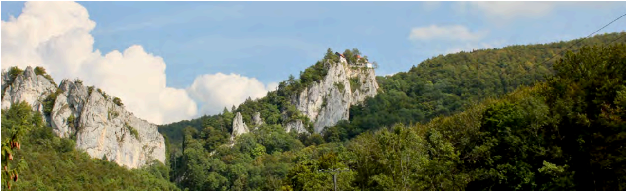
Im Donaudurchbruch nahe der Burg Wildenstein