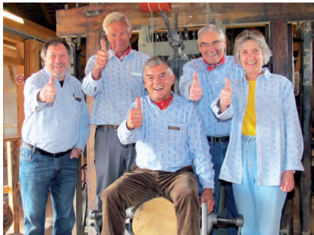
Freude herrscht... auch in unserem Vorstand

Neue Mitglieder sind herzlich willkommen.