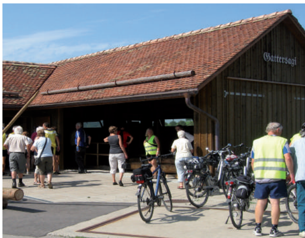
Führung mit Apéro während der Velotour